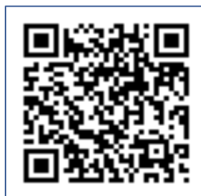
大分こども病院専用QRコード